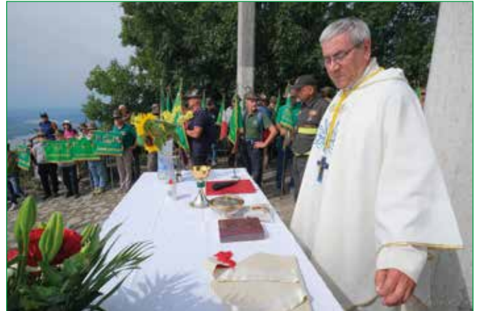
Don Franco Gallivanone, Vicario Episcopale Zona II - Varese, ha celebrato la Santa Messa all'Altare delle Tre Croci, in memoria dei Caduti senza Croce e dei Caduti nelle guerre e nelle operazioni di pace.

modo, erano ordinate le code per prendere gli ottimi piatti che i cuochi avevano preparato lavorando dalle prime ore del mattino.