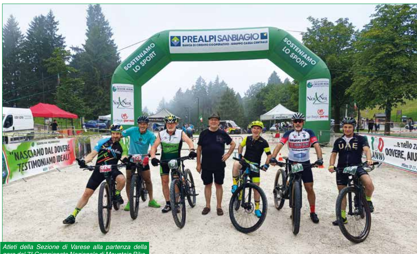
Atleti della Sezione di Varese alla partenza della gara del 7° Campionato Nazionale di Mountain Bike.