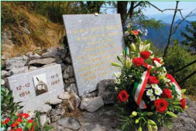
A metà della salita lungo la Via Sacra in ricordo di Mons. Tarcisio Pigionatti, promotore della realizzazione, è posta la targa che l'Unità di Protezione Civile della Sezione di Varese ha restaurato quest'anno.